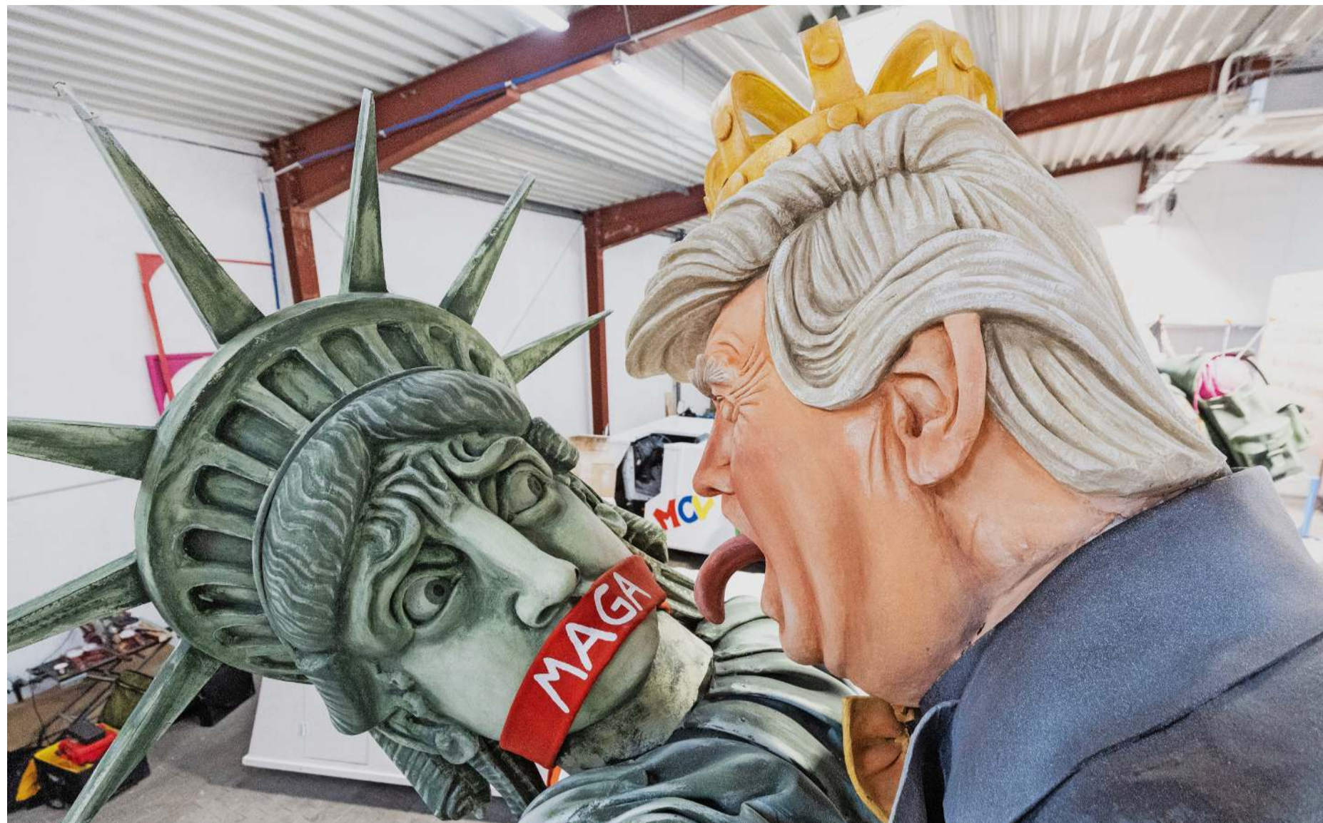
Stürmisch: US-Präsident Donald Trump versucht, die Freiheitsstatue zu küssen – zumindest auf dem Motivwagen der Mainzer Fastnachter.