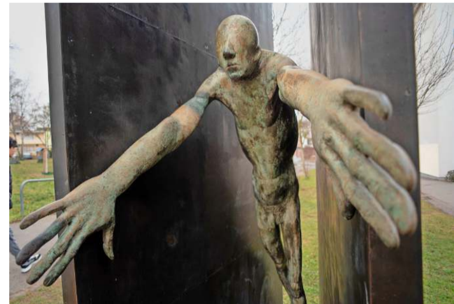
Ausbruch: die Skulptur „Mann aus der Enge heraustrhend II“

„Die Rückkehr dieser Skulptur in den öffentlichen Raum würdigt nicht nur einen bedeutenden Künstler, sondern auch seine enge Verbindung zur Stadt. Das Werk steht sinnbildlich für Aufbruch, menschliche Entwicklung und die Kraft der Kunst im urbanen Raum“, sagte Benz. „Die Skulptur ist ein wichtiges Zeugnis der Darmstädter Kunstgeschichte. Mit ihrer Rückkehr in den öffentlichen Raum wird das Programm figurlicher Kunst von der Innenstadt über die Erich-Ollenhauer-Promenade und die Mathildenhöhe bis zur Rosenhöhe eindrucksvoll ergänzt“, führte Philipp Gutbrod, Kulturreferent der Wissenschaftsstadt Darmstadt und Direktor des Instituts Mathildenhöhe, aus. höv.