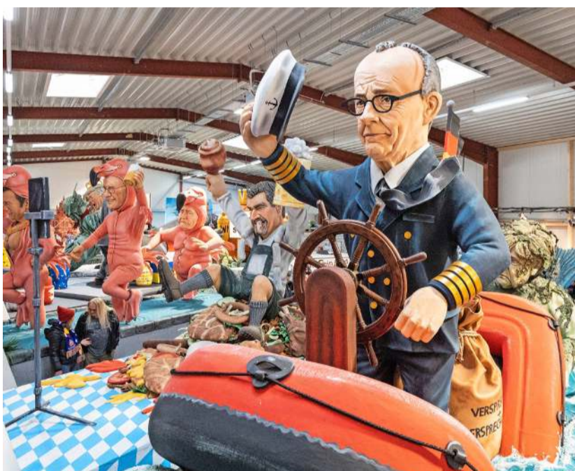
Auf großer Fahrt: Das Schlauchboot von Kanzler Merz hat ein Loch.

rigen Narrenparade „seinen“ Wagen verdient. Auf dem er sich, ganz so, wie man es eigentlich gar nicht sehen möchte, beim Tanzen ohne Regeln an der Freiheitsstatue vergeift, die dem stürmischen Egomane allem Anschein nach kaum etwas entgegenzusetzen hat. Der