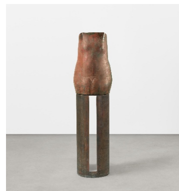
Waldemar Otto Großer weiblicher Torso XII (Stehend) 1995 | Bronze | 186,5 x 50,5 x 35 cm Taxe: € 8.000 – 12.000