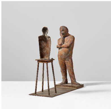
Waldemar Otto Macher und Machwerk III | 1989 Bronze, hellbraun patiniert | 52,5 x 56,7 x 20,5 cm Taxe: € 10.000 – 15.000