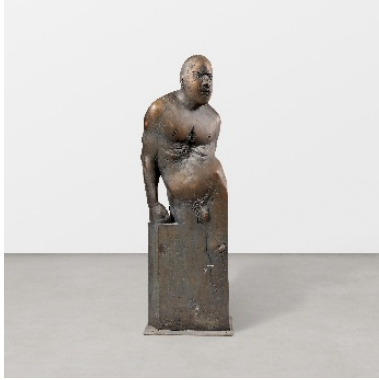
Waldemar Otto Großer Hephaistos IV | 1988 Bronze, dunkelbraun patiniert | 192 x 59,5 x 39 cm Ergebnis: € 32.000

Internationaler Auktionsrekord für diesen Künstler*