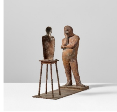
Waldemar Otto Macher und Machwerk III | 1989 Bronze, hellbraun patiniert | 52,5 x 56,7 x 20,5 cm Ergebnis: € 6.000

Internationaler Auktionsrekord für diesen Künstler*